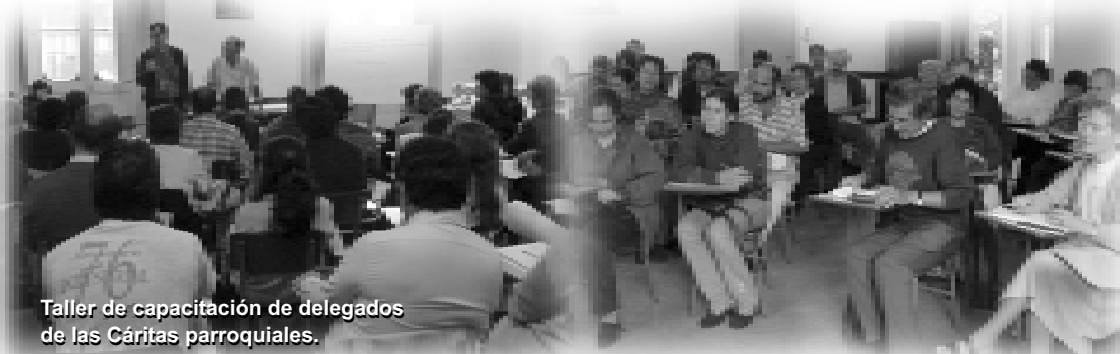
Taller de capacitación de delegados de las Cáritas parroquiales.

Está en nosotros, por lo tanto, recrear ese animarse para que nuestra misión sea fértil.