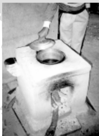
Una de las cocinas Emmita.