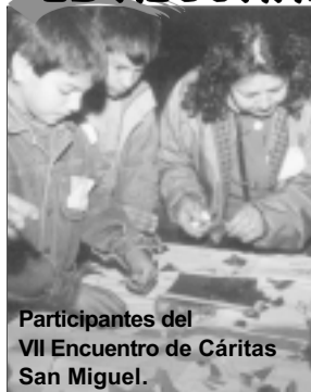
Participantes del VII Encuentro de Cáritas San Miguel.