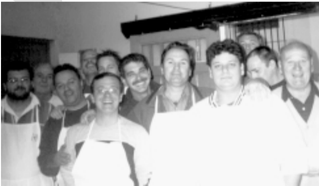
Voluntarios que sirvieron a sus compañeros en el almuerzo de Cáritas San Martín

Con la idea de celebrar la labor de aquellos que entregan su amor y tiempo a los más necesitados y de reunir la familia de Cáritas en un encuentro comunitario, se organizó el pasado 17 de agosto un almuerzo para los más de 600 voluntarios que trabajan en la diócesis de San Martín. El