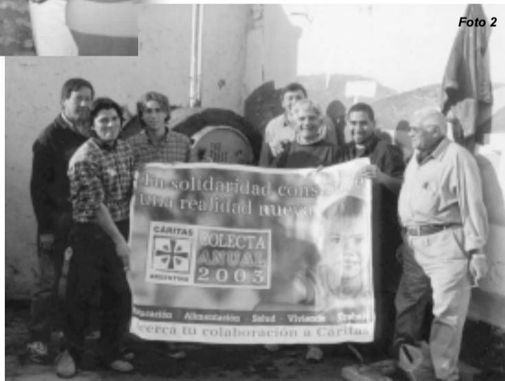
(1 y 2) Participantes del taller junto a los hornos económicos.