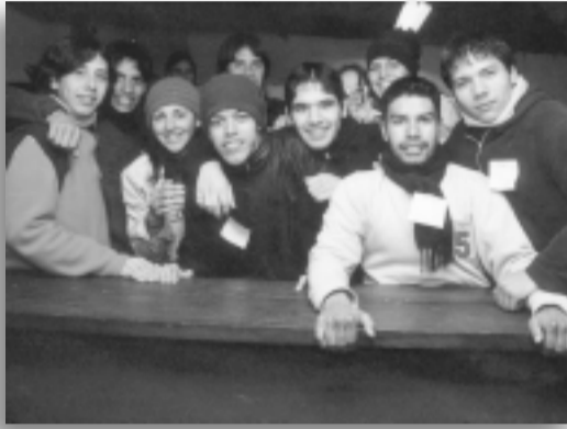
Grupo de jóvenes que participaron del encuentro.

En este sentido, luego de una de las actividades previstas, quienes participaron del encuentro concluyeron que «no siempre percibimos de manera cierta, la magnitud de nuestra obra y que esa «parte que me toca» es fundamental para lograr la verdadera unión. Esa es la comunicación a la que nos llama Jesús. Una comunicación que nos encuentra y nos realiza como co-