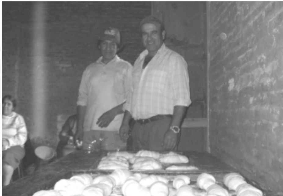
Alumnos del curso de panadería.