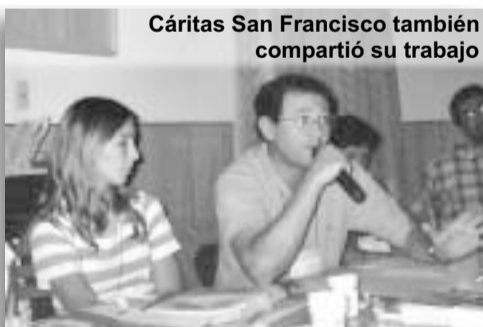
Cáritas San Francisco también compartió su trabajo

Cáritas Formosa contó a partir de su experiencia, cómo a través de la Colecta se puede ejercer una comunión de bienes, de forma que sea una ocasión de crecimiento para toda la comunidad.