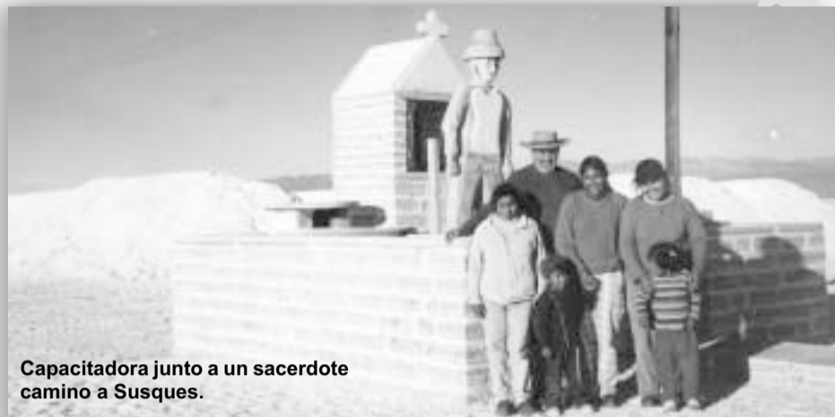
Capacitadora junto a un sacerdote camino a Susques.

sustento propio y de su familia. Para ello, Cáritas financia la compra de herramientas y materias primas.