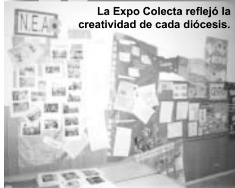
La Expo Colecta reflejó la creatividad de cada diócesis.

Fue un Encuentro cálido, donde no faltó la animación, la reflexión y el análisis que permitió estrechar vínculos entre los jóvenes espíritus de los históricos referentes y los nuevos que estaban llenos de expectativas. En un cierre lleno de emoción, regresamos a Santa Fe con esas ganas de hacer realidad un país sin excluidos.