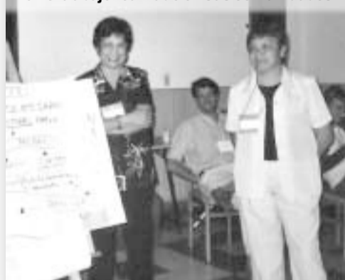
Referentes de Cáritas Corrientes compartieron el trabajo realizado en sus comunidades.

(ofrenda regional compartida en la oración de inicio)