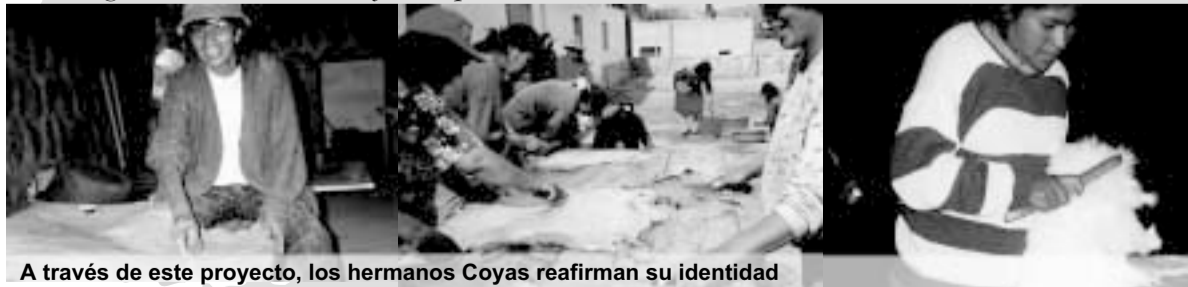
A través de este proyecto, los hermanos Coyas reafirman su identidad