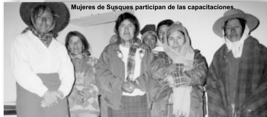
Mujeres de Susques participan de las capacitaciones.

El acento está dado en fortalecer los micro emprendimientos de pequeños artesanos para que puedan mejorar sus recursos económicos destinados al