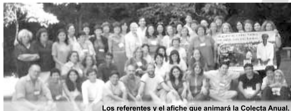
Los referentes y el afiche que animará la Colecta Anual.