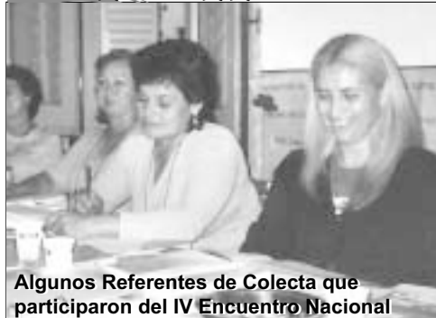
Algunos Referentes de Colecta que participaron del IV Encuentro Nacional