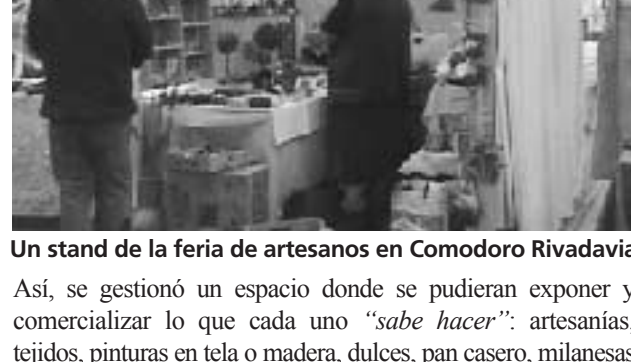
Un stand de la feria de artesanos en Comodoro Rivadavia

Frente a la crítica situación de desempleo de los últimos años, numerosas familias buscaron distintas alternativas para la subsistencia, entre ellas la producción de artesanías para su posterior venta. Así, la Colecta Anual del 2002 despertó un nuevo desafío para la diócesis: pasar de la asistencia a la promoción humana. En este sentido, para animar la colecta y al mismo tiempo facilitar la inserción de los productos al mercado, impulsaron la primer feria de artesanas.