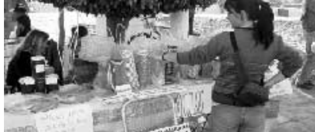
Los microempreendedores de Goya tuvieron la oportunidad de ofrecer sus productos durante el encuentro.