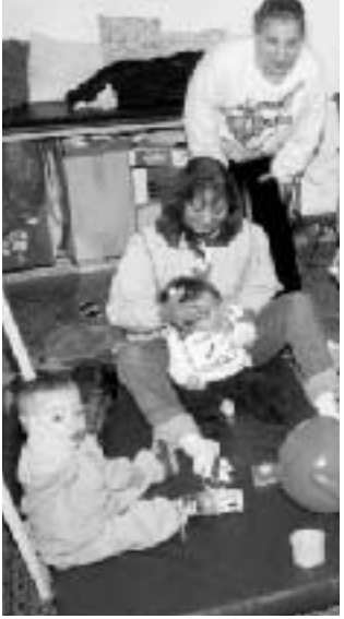
Algunos de los chicos junto a las voluntarias de La Sagrada Familia.

En la localidad de Alderete, a 7 km de la ciudad de San Miguel de Tucumán, Cáritas sostiene el Taller La Sagrada Familia, al que concurren 90 personas, entre niños, jóvenes y adultos con necesidades especiales.