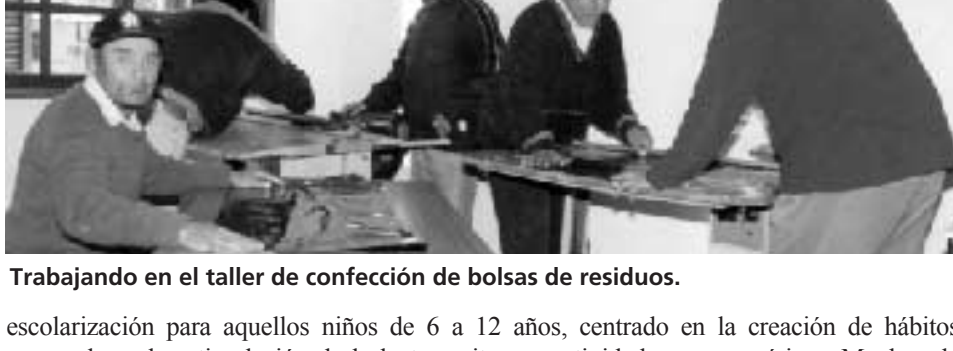
Trabajando en el taller de confección de bolsas de residuos.

Con los bebés y niños hasta los 6 años de edad se desarrollan actividades para mejorar la sensorio-percepción y la socialización. También se cuenta con un Taller de