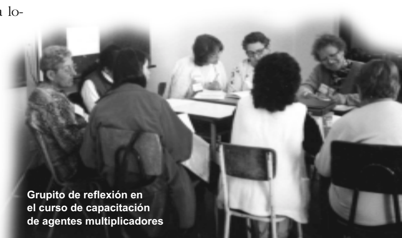
Grupito de reflexión en el curso de capacitación de agentes multiplicadores

"Las principales riquezas de este curso están en descubrir las posibilidades y potencialidades de cada uno, en la valoración de servir, lo que se puede lograr aunando y coordinando esfuerzos, la alegría del dar y darse. Además nos está permitiendo descubrir en los tutores gente con posibilidades de colaborar con la dio-