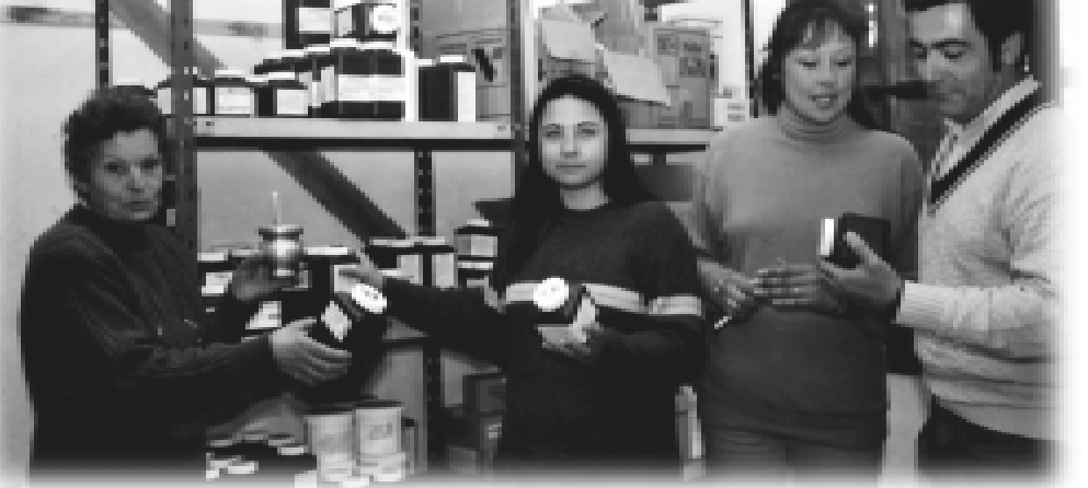
Voluntarios de la Red de Farmacias Solidarias organizando los medicamentos.

que aún hoy resisten la difícil situación económica; y otros sectores que cuentan con villas o asentamientos históricos ya afianzados aunque muy vulnerables en cuanto a la calidad de vida de sus habitantes.