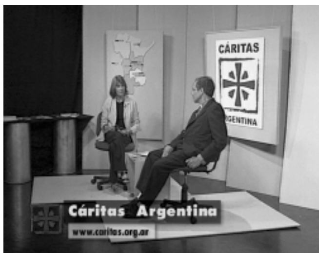
Los conductores en el estudio donde grabamos Huellas de Esperanza.

Queremos compartir la alegría por el inicio del ciclo televisivo «Huellas de Esperanza».