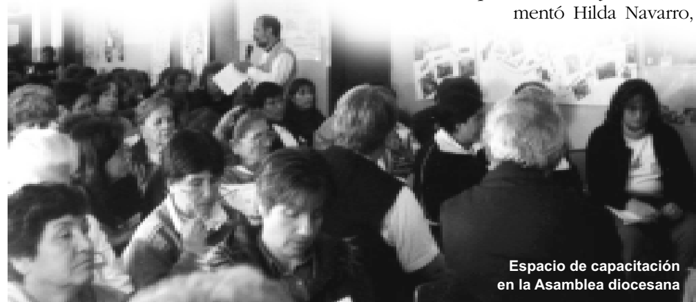
Espacio de capacitación en la Asamblea diocesana