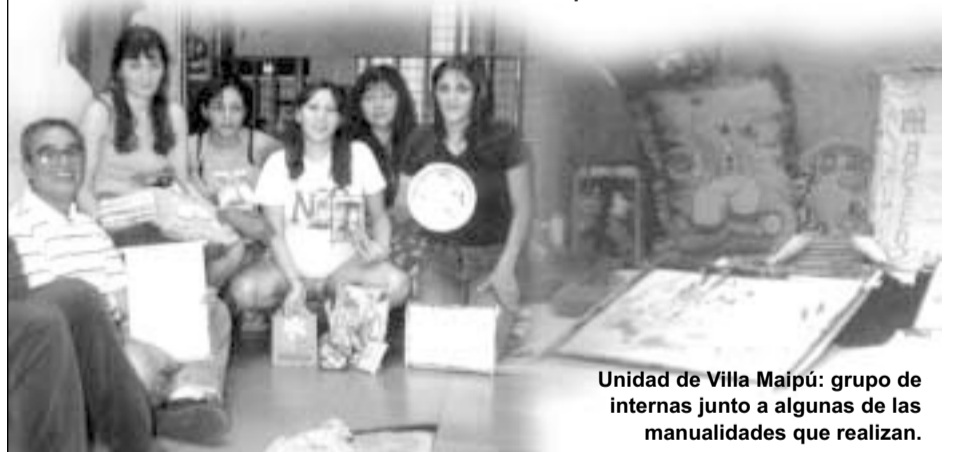
Unidad de Villa Maipú: grupo de internas junto a algunas de las manualidades que realizan.