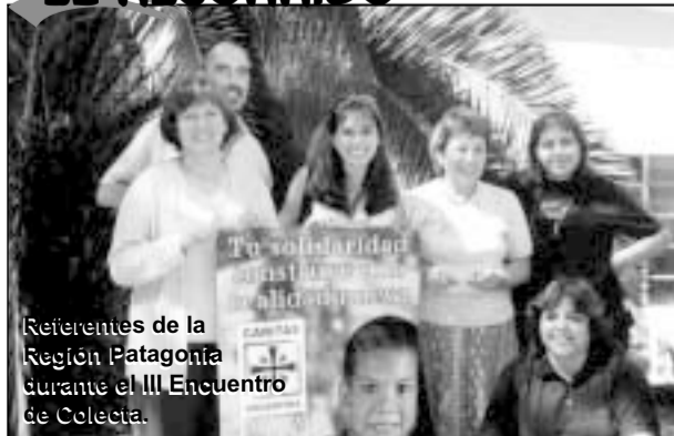
Referentes de la Región Patagonia durante el III Encuentro de Colecta.