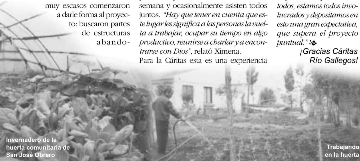
Invernadero de la huerta comunitaria de San José Obrero