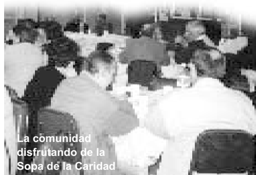
La comunidad disfrutando de la Sopa de la Caridad