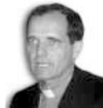
Por: Mons. Jorge Casaretto

Que en las opciones y conversiones a las que estamos llamados diariamente, siempre podamos elegir con fuerte convicción por el camino de Jesús. ✠