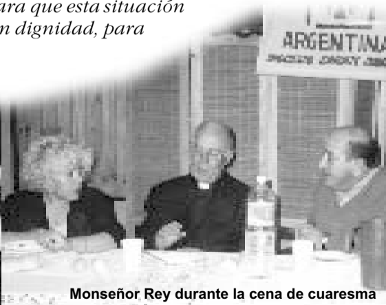
Monseñor Rey durante la cena de cuaresma