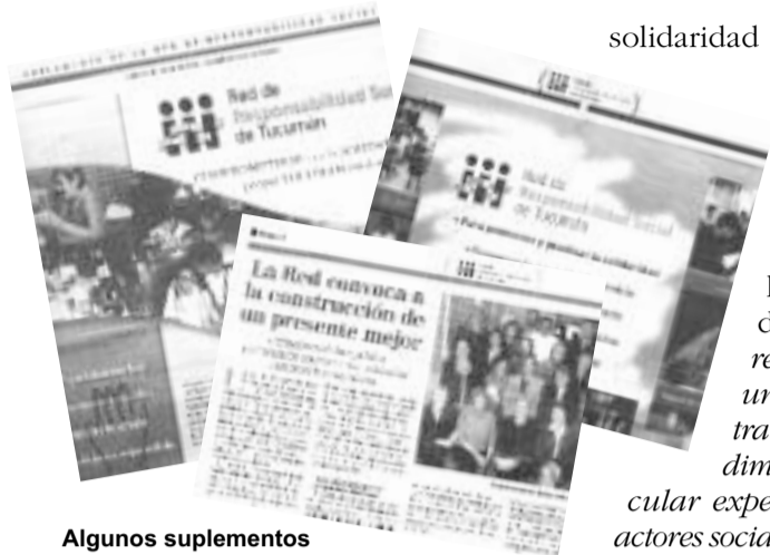
Algunos suplementos publicados en el diario La Gaceta

Ante la difícil situación que viven tantos hermanos nuestros, desde Cáritas estamos convencidos que buscar alternativas comunitarias puede ser uno de los caminos que nos permita superar la cultura del "sálvese quien pueda" tan instalada en nuestra sociedad. Desde este espíritu, hace un año que Cáritas Tucumán integra un grupo de organizaciones solidarias, con valores y visiones sociales compartidos, conformando la Red de Responsabilidad Social de Tucumán. Su propósito principal es promover la cultura de la